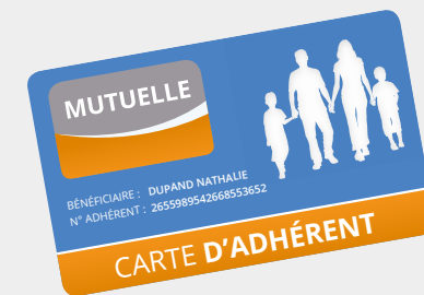
Carte de mutuelle